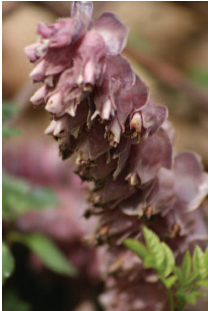
Kónya vicsorgó ~ Lathraea squamaria ~ régi tavaszok idézője

Egyszóval múlt vasárnap köszöntött rám a kónya vicsorgó (Lathraea squamaria) egy