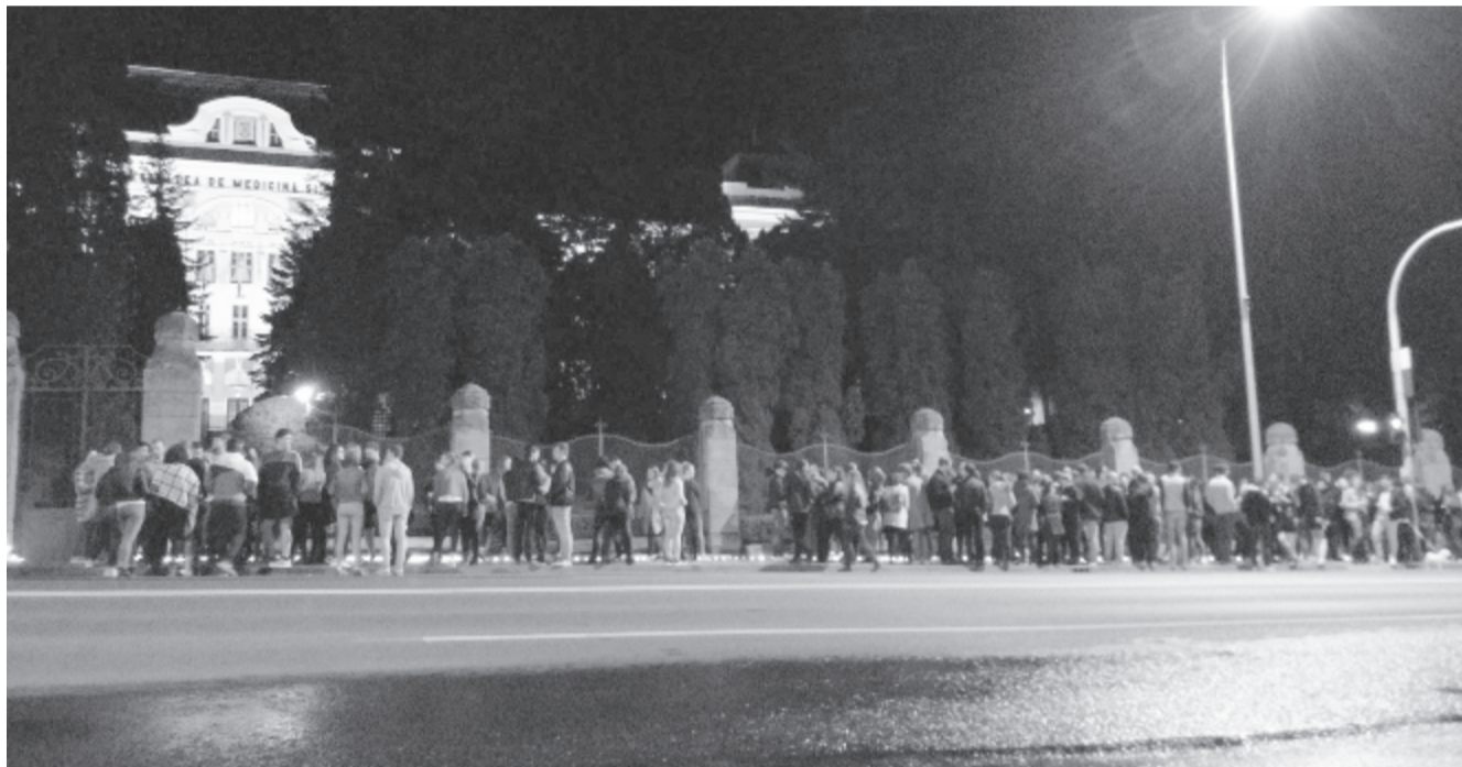
Szerda esti gyertyagyújtás a MOGYE előtt