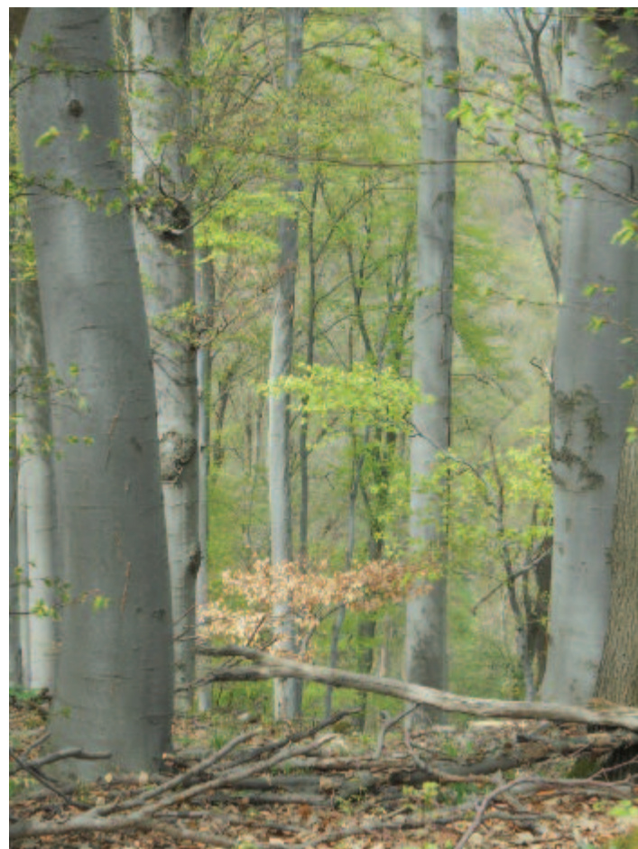
A régi erdők bájkörébe lépek

Az 1990-ben világmozgalommá vált Föld napja harminc évvel ezelőtt a bioszféra pusztulását, az ipari szennyezést, az öserdők irtását, a sivatagok terjeszkedését, az üvegházhatást, az ózonlyukakat, a veszélyes